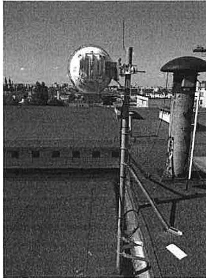
Tabela nr 8

Widok obiektu wraz z zainstalowanym zespołem antenowym