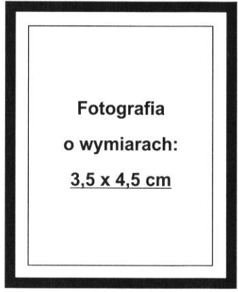
(nie wykraczać poza ramkę wewnętrzną)