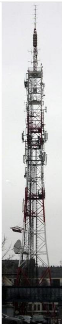
Fot. 1. SLR Białystok / Centrum – widok obiektu