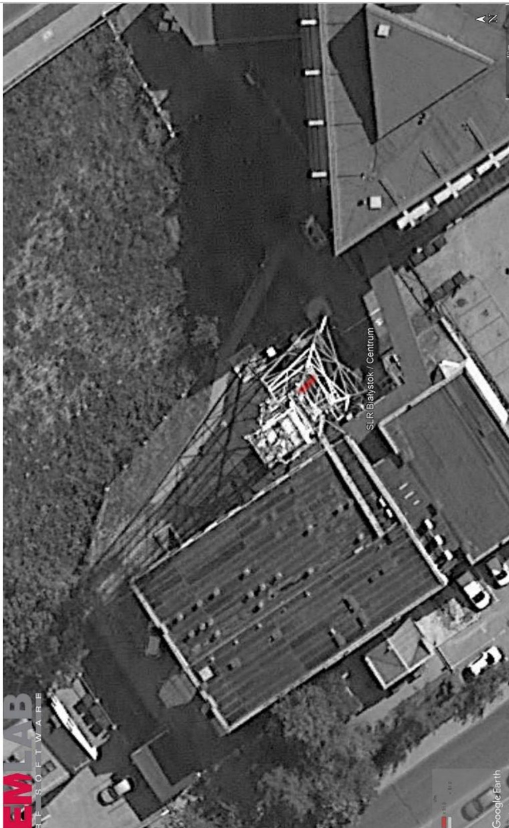
Rys. 2. Rzut poziomy rozkładu pola elektromagnetycznego anteny nowo projektowanej linii radiowej w otoczeniu SLR Białystok / Centrum przewidzianej do zainstalowania na wysokości 45 m nad poziomem terenu.