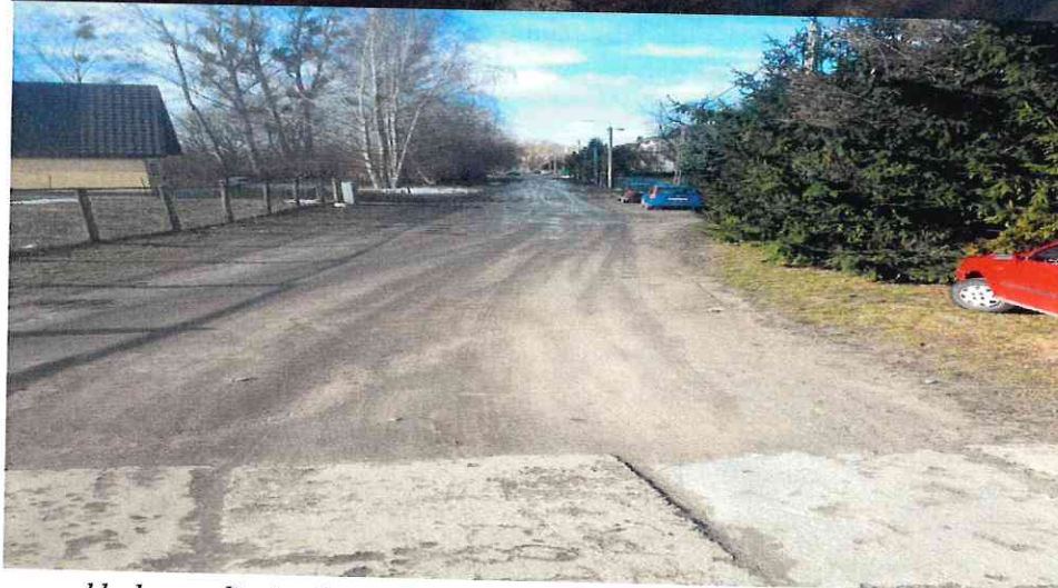
- przykładowe zdjęcia ul. Długiej nadesłane przez Mieszkańca.