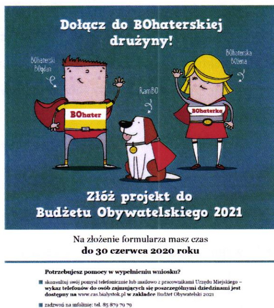
Zdjęcie 1. Plakaty informacyjne o Budżecie Obywatelskim 2021

W trakcie realizacji poszczególnych etapów Budżetu Obywatelskiego 2021 wdrożono działania informacyjno-promocyjne polegające m.in. na: nagraniu i emisji spotów dźwiękowych w lokalnych rozgłoszeniach radiowych oraz autobusach miejskich, ekspozycji plakatów na słupach ogłoszeniowych, w obiektach handlowych i kulturalnych, dystrybucji broszur informacyjnych do skrzynek pocztowych mieszkańców, a także zintensyfikowane działania informacyjne w mediach społecznościowych. Ze względu na stan epidemii wywołanej SARS-CoV-2 ograniczono działania informacyjne polegające na bezpośrednim kontakcie z mieszkańcami.