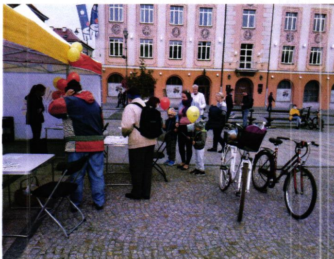
Zdjęcie 5. Namiot jako punkt mobilny do głosowania ustawiony na Rynku Kościuszki oraz grupa kilku osób biorących udział w głosowaniu na projekty do Budżetu Obywatelskiego 2021