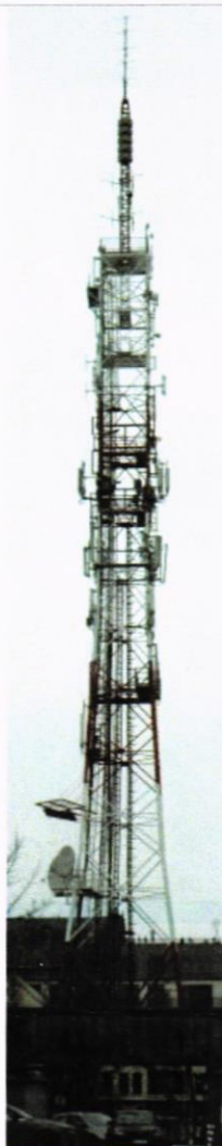
Fot. 1. SLR Białystok / Centrum – widok obiektu