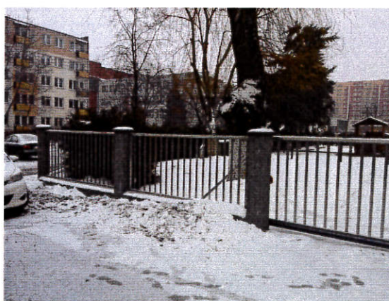
Zdjęcie nr 6.