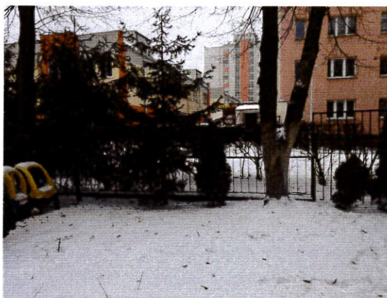
Zdjęcie nr 4.