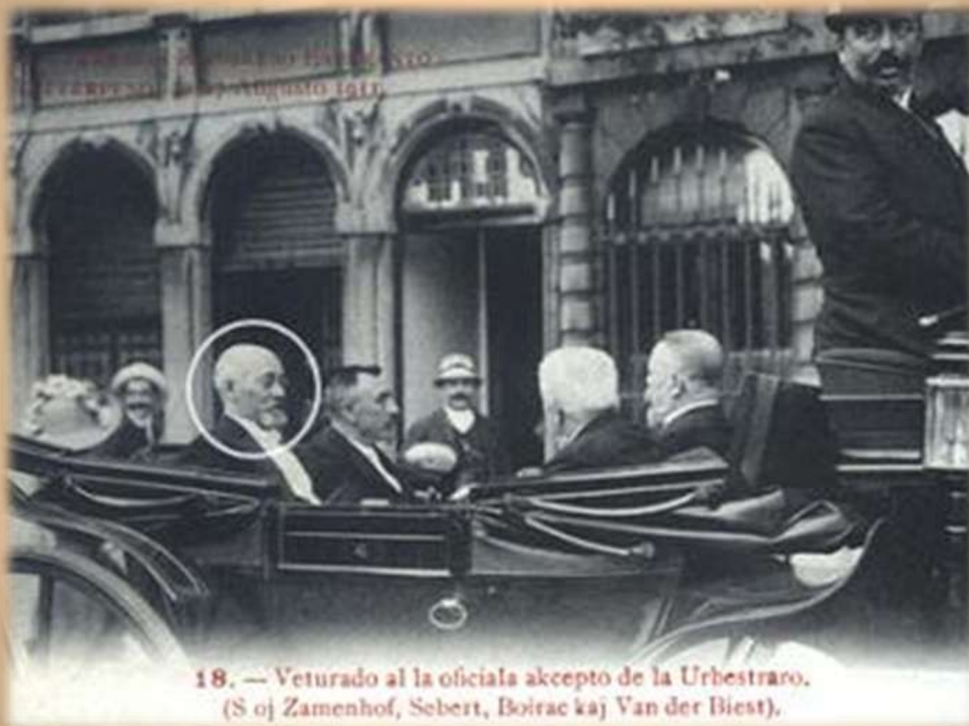
18. — Veturado al la oficiala akcepto de la Urbestro. (S-oj Zamenhof, Sebert, Boirac kaj Van der Biest).