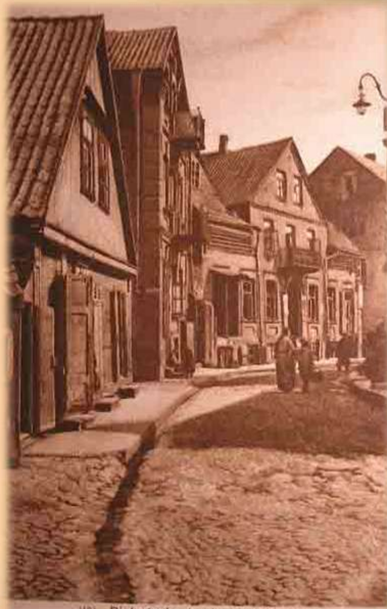
116) Białystok - Im. Józefa Stojanowicza

Obecnie rejon pomiędzy ulicami Krakowską i Młynową.