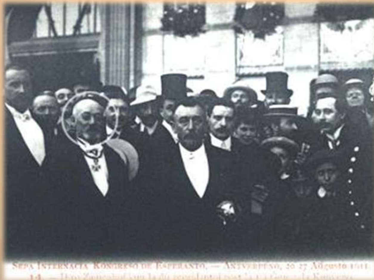
SEPA INTERNACIA KONGRESO DE ESPERANTO, — ANTWERPEN, 20-27 Aŭgusto 1911. 14. — Tio ĉi Zamenhof kun la du ĉefdelegitoj, estis la 1-a ĉefo de la Kongreso.