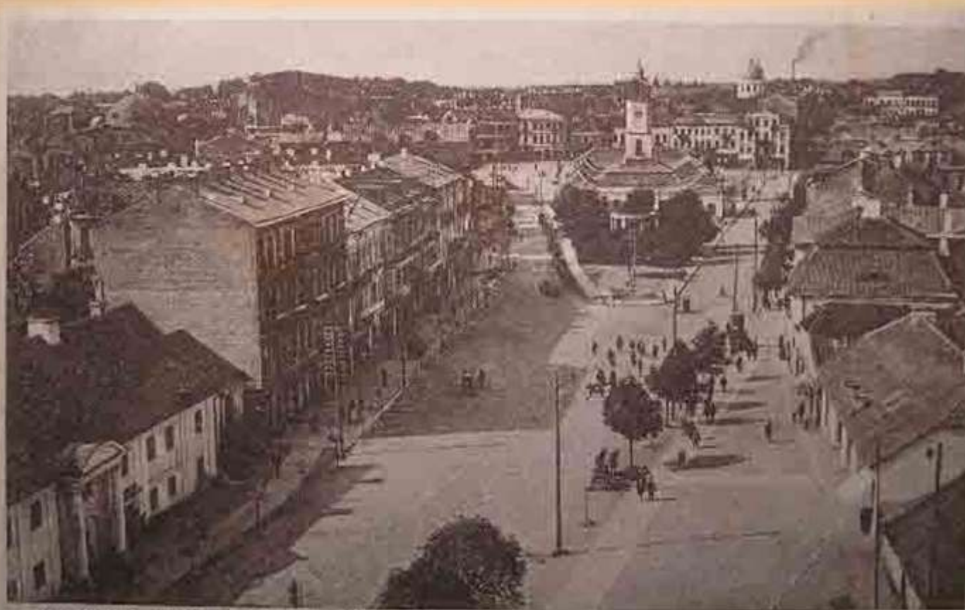
BIAŁYSTOK, Rynek Kościuszki z lotu ptaka.

Ogólny widok na rynek i ratusz. Po lewej w oddali kopuła wielkiej synagogi.